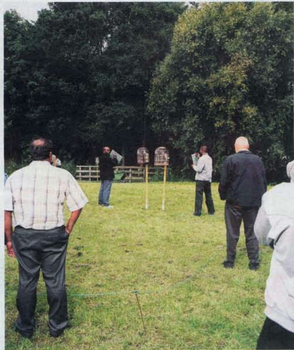
De mannen van vogelvereniging Beef-Free komen 's zondags bij elkaar om hun vogels tegen elkaar te laten strijden. De wedstrijden beginnen vroeg, soms al om half 8's ochtends. Twee vogelkooitjes worden naast elkaar gezet waarop scheidsrechters een kwartier lang bijhouden hoeveel riedeltjes ze maken. Wie de meeste riedels fluit wint.